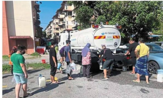
Only three water tankers were despatched to Taman Melati Flats during the three-day unscheduled water supply disruption.